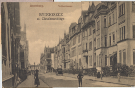
Budynek, tablica pamiątkowa, ul. A. Cieszkowskiego