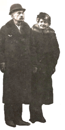
Obserwatoryj defilady Wojska Polskiego, pl. Wolności, 22.01.1920

Do liczby masztów stojących przed wejściem do ratusza, dodaj dwa.