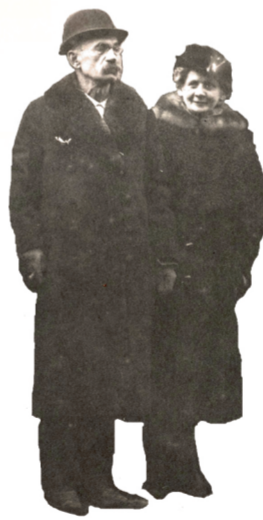
Obserwatorzy deflady Wojska Polskiego, pl. Wolności, 22.01.1920

Do liczby masztów stojących przed wejściem do ratusza, dodaj dwa.