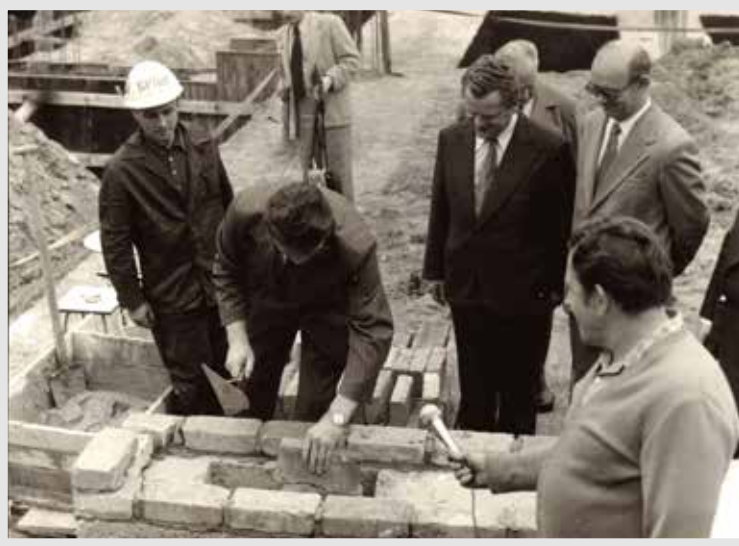
Wmurowanie aktu erekcyjnego

Z uwagi na sytuację epidemiologiczną w kraju, obchody 40-lecia Szpitala Uniwersyteckiego nr 2 im. dr. J. Bizuela w Bydgoszczy zostały przełożone na późniejszy termin.